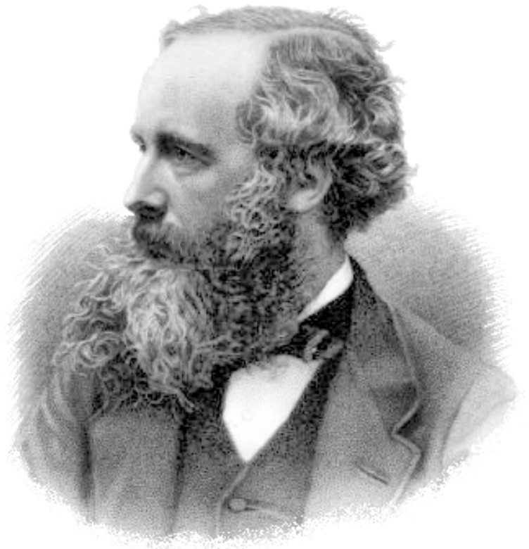
James Clerk Maxwell

La ràdio s'ha anat desenvolupant, adaptant i evolucionant fins avui en dia, convertint-se en una de les TIC més utilitzades arreu del món gràcies a la seva accessibilitat.