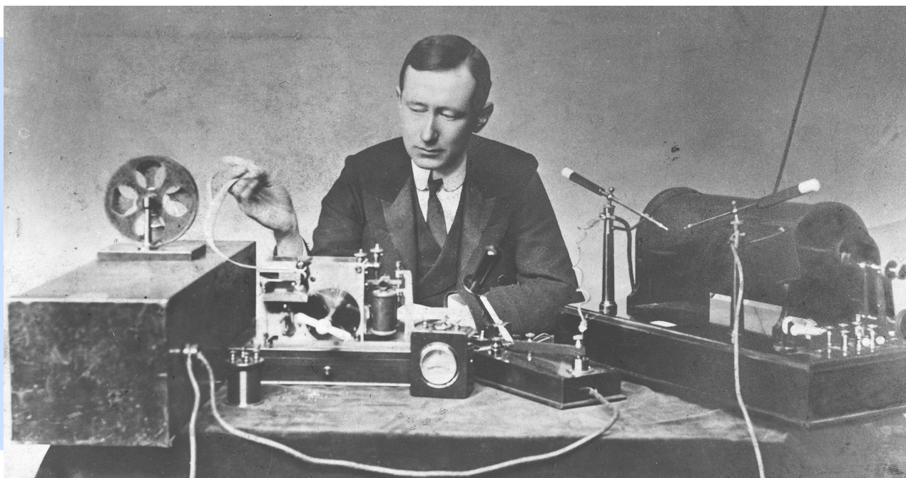
Guglielmo Marconi amb el transmissor (dreta) i el receptor (esquerra) que va utilitzar en algunes de les seves primeres transmissions de radiotelegrafia de llarga distància durant la dècada de 1890.