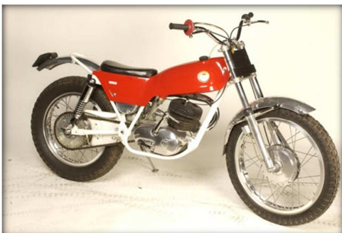
MONTESA COTA 247

La Cota de trial va ser el model més popular del mercat, amb més de 80.000 unitats venudes, i el trial es va convertir en la modalitat de muntanya més practicada. Això va fer que es produïssin versions en totes les cilindrades, des de la Cota 25 per a nens que volien iniciar-se en aquest esport, fins als models més competitiu que van acabar triomfant en els campionats nacionals de molts països.