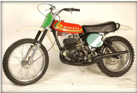
MONTESA CAPPRA 250VA

El motocròs va esdevenir la modalitat esportiva més espectacular del motociclisme fora de carretera, per la qual cosa Montesa va llançar al mercat el seu model de motocròs, la Cappra, i va organitzar el Trofeu Montesa obert a tots els pilots que tenien una Cappra 125.