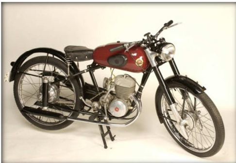
MONTESA BRIO 90

El nou model, la D-51 va incorporar novetats importants com la suspensió en forma de forquilla telescòpica al davant i una suspensió telescòpica lliscant al darrere, embragatge en bany d'oli, cubs de fre de fosa. El dipòsit, de forma arrodonida i color vermell, va ser l'origen del color vermell característic de la marca durant molts anys. Aquest model va ser el precursor de la posterior línia de motocicletes Brio.