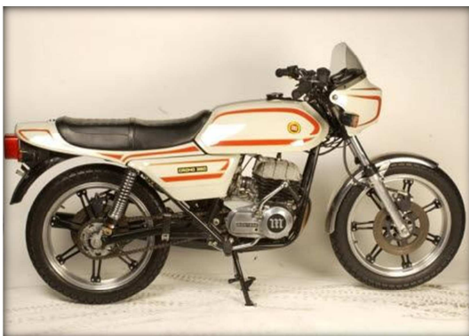
MONTESA CRONO 350

Actualment, la marca catalana continua viva i els èxits esportius aconseguits en l'especialitat del trial donen continuïtat a molts anys d'esforç de diverses generacions.