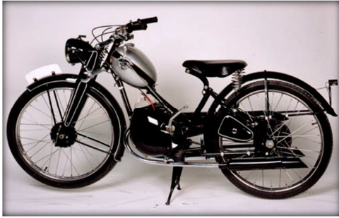
MONTESA A45 versió femenina