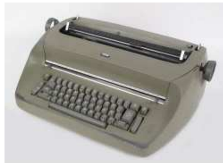
IBM Selectric (1961)