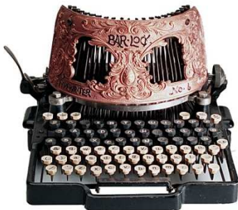
Royal Bar-lock (1896)

En relació al disseny dels aparells, l'exposició mostra models excepcionals: les Virotyp del 1914, màquines de mà pensades per ser utilitzades dalt del cavall; la Royal Bar-lock de 1896, tot un exercici de barroquisme, o l'estil Art Nouveau de la màquina d'índex Odell 4. També s'hi exposen icones del disseny italià de la segona meitat del segle XX, com la popular Valentine o la Studio 45, totes dues d'Hispano-Olivetti.