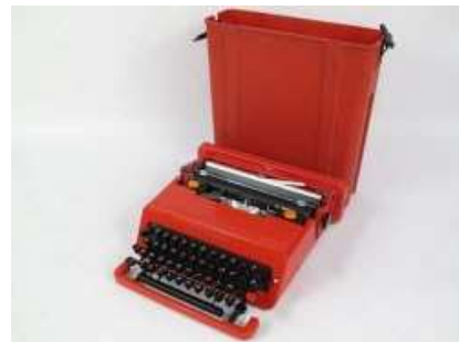
Hispano-Olivetti, model Valentine (1969)

Des d'un punt de vista tècnic, es mostren models més representatius de la història d'aquests dispositius. En primer lloc cal destacar la Sholes&Glidden (1875), recentment adquirida pel mNACTEC, considerada la màquina d'escriure més influent de la història i a la qual devem el sistema de teclat QWERTY que utilitzen avui tots els ordinadors i dispositius mòbils. També són models destacats la Pittsburg Visible (1898), una de les primeres màquines que deixava veure a l'operari allò que estava escrivint (d'aquí el sobrenom de "Visible"); la Remington elèctrica (1925), una de les primeres màquines elèctriques de la història, i l'IBM Selectric (1961), que va revolucionar definitivament el mercat a partir de la seva aparició.