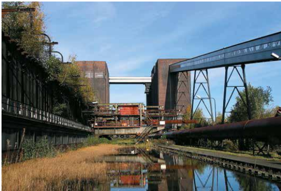
Planta de producció de coc Hansa, a Dortmund