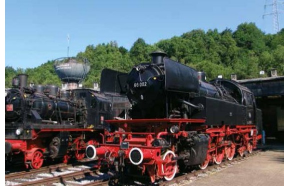
Museu del Ferrocarril de Bochum