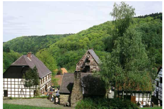
Museu a cel obert de Westfàlia-Lippe, a Hagen