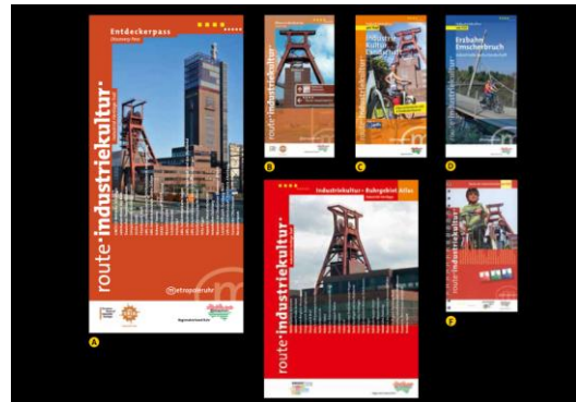
Materials gràfics de difusió

Per últim es fa esment de la Ruta Europea del Patrimoni Industrial (ERIH, en les seves sigles en anglès), formada per 1.350 emplaçaments de 45 llocs de tot Europa. La ruta virtual principal està formada per monuments industrials destacats i oberts al turisme, els denominats "punts d'ancoratge". Les rutes regionals il·lustren el passat industrial de regions concretes i les rutes temàtiques europees mostren les interrelacions a escala europea.