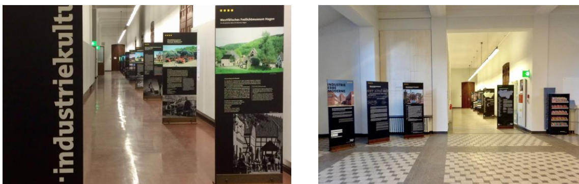
L'exposició itinerant s'ha pogut visitar ja a diversos museus i espais d'Alemanya

La mostra té el suport de les tres institucions internacionals més importants en l'àmbit del patrimoni industrial, que per primera vegada han treballat conjuntament en un projecte: TICCIH (The International Committee for the Conservation of the Industrial Heritage), ERIH (European Route of Industrial Heritage) i Industrial and Engineering Committee d'Europa Nostra. El projecte ha comptat també amb el suport de l'Institut Goethe de Barcelona i de diverses associacions d'arquitectes.