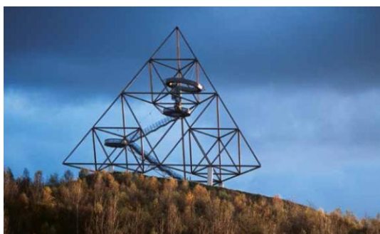
Tetraeder, a Bottrop

Les nombroses colònies són il·lustratives de la història social de la regió del Ruhr. Construïdes just al costat de les fàbriques, servien per allotjar la mà d'obra necessària per a la mina, la indústria siderúrgica, la indústria ferroviària i la gestió de l'aigua.