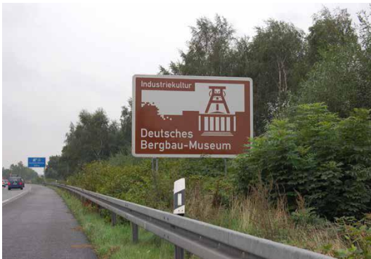
Senyalització de vies

En aquest apartat s'exposen també els materials gràfics de difusió de la ruta: fulletons, mapes, guies, etc.