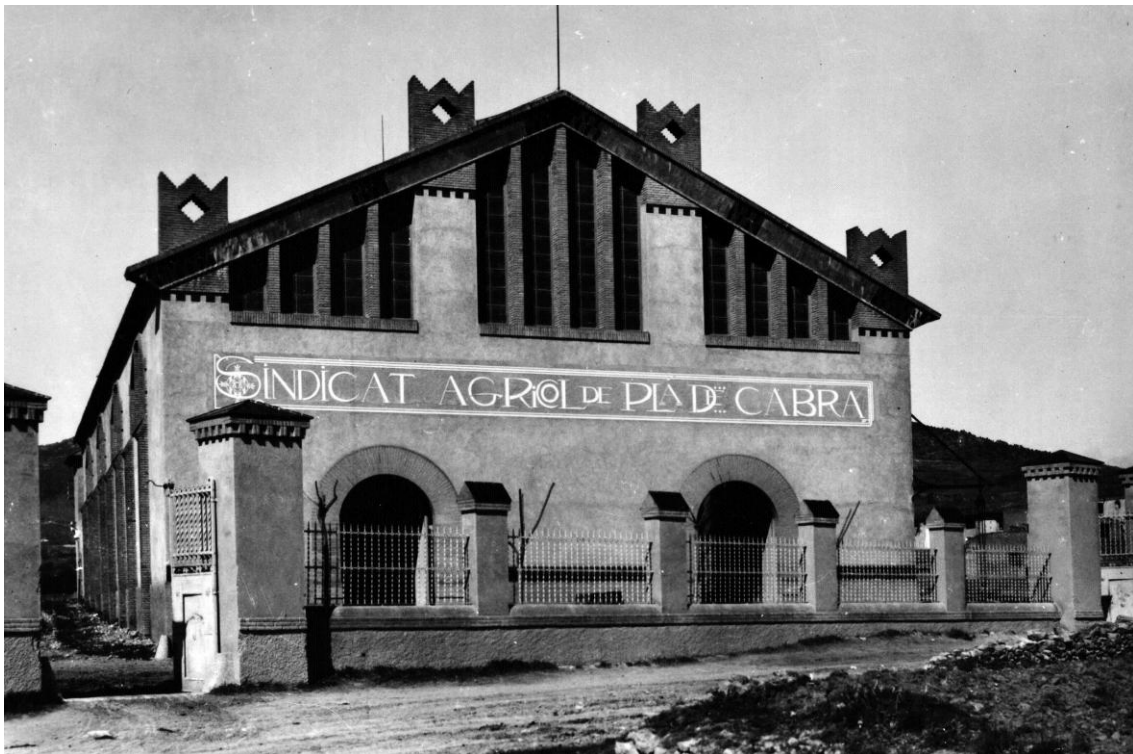
Celler de la Cooperativa Agrícola del Pla de Santa Maria, 1919-1925.

Feia retrats i fotografies de monuments per a la Mancomunitat de Catalunya i amb un grup d'amics va aconseguir canviar radicalment la ciutat amb la creació de l'agrupació Amics de les Belles Coses que lluitava per la modernització cultural, social i econòmica: volia nous trens, un camp d'aviació, millor transport, més turisme, més obertura. Finalment, la política va trucar a la seva porta i es va comprometre amb el progrés que representava la República, però no es va presentar com a candidat; volia marxar.