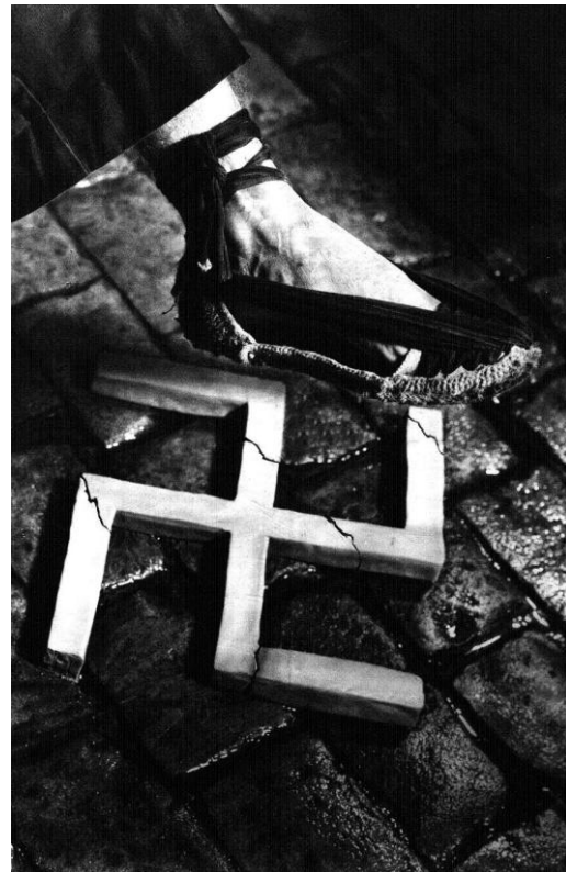
Aixafem el feixisme, 1936