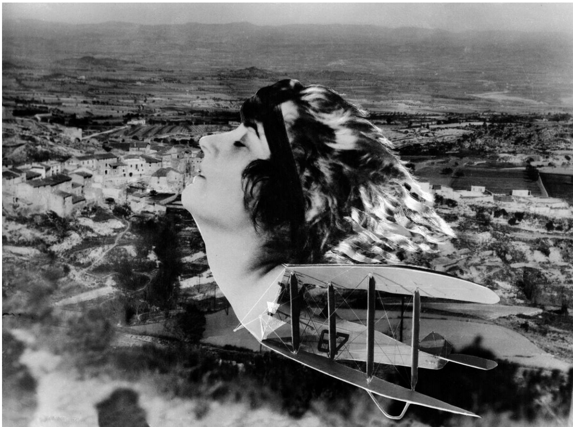
Desig de vol, 1929-1932.