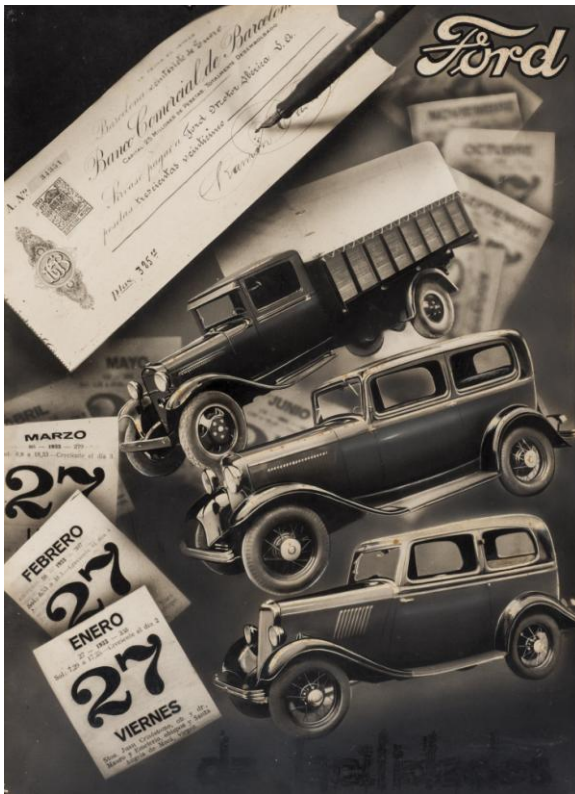
Ford, 1933.

Durant la Guerra Civil espanyola, va concebre amb Jaume Miravittles el Comissariat de Propaganda i va crear un dels cartells de guerra més famosos: «Aixafem el feixisme». Com a cap d'Edicions va mantenir contactes amb tots els intel·lectuals, va publicar la reconeguda revista Nova Ibèria i més de 200 llibres, revistes, auques i pamflets en quatre llengües.