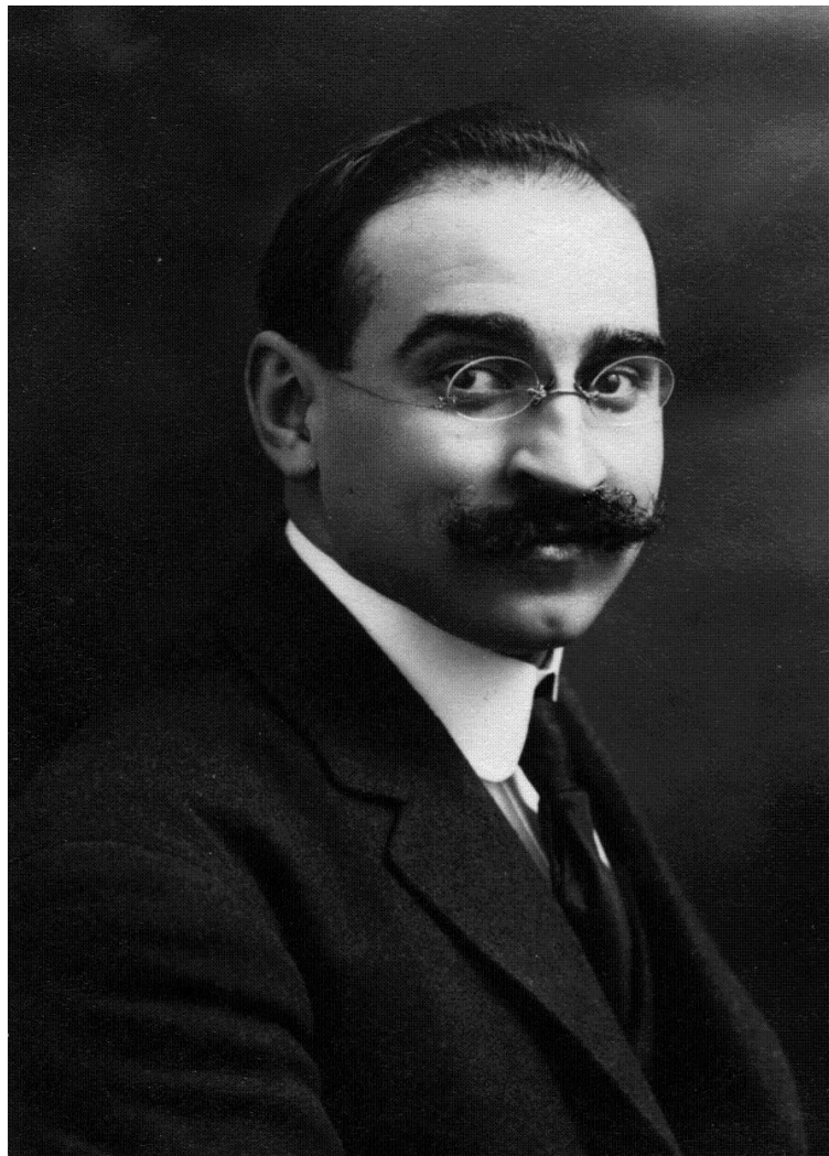
Pere Català i Pic, anys 1920.

Català i Pic és conegut sobretot com a fotògraf i com a autor del famós cartell «Aixafem el feixisme», però també va treballar en un banc, va ser aprenent, pintor i retratista, pare, activista de la pàtria petita, fototècnic publicitari, articulista i professor del Seminari de Publicitat, creador del Comissariat de Propaganda i cap d'edicions, literat sense publicacions, fotògraf industrial i artístic, calçotaire, alguerista, sardanista, viatger incansable i, sobretot, amic dels amics.