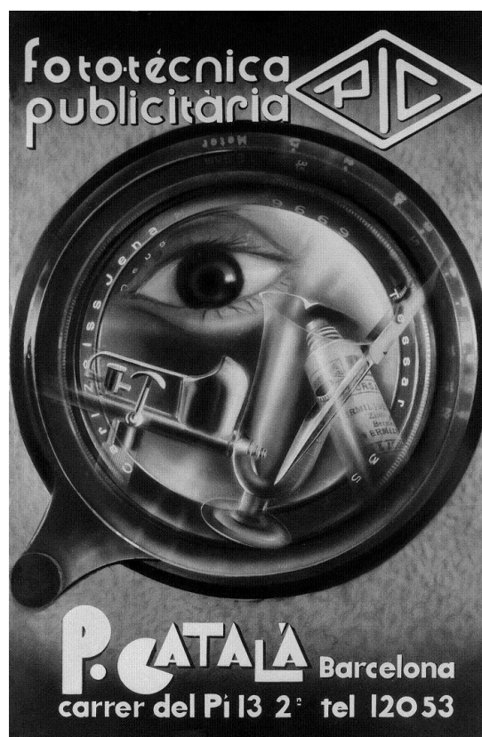
Fototécnica publicitària PIC, 1932