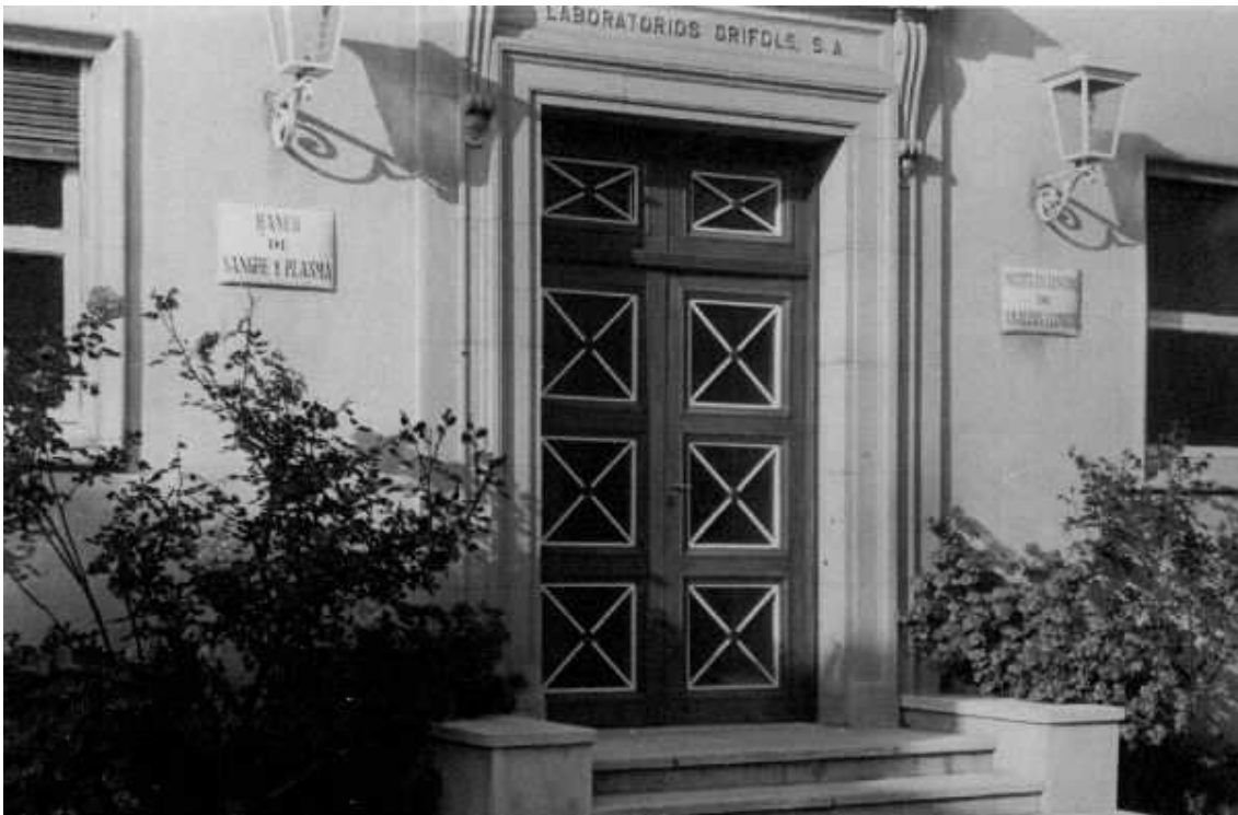
Antiga seu dels Laboratoris Grífols, situada al número 6 del carrer Jesús i Maria, a Barcelona. Actualment és la seu de la Fundació Víctor Grífols i Lucas i del Museu Grífols.