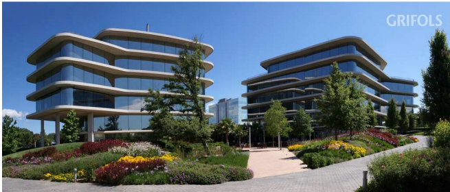
Seu central de Grifols a Sant Cugat del Vallès

“La internacionalització” il·lustra com Grifols va diversificar els seus productes i es va expandir internacionalment fins esdevenir una empresa que cobria tot el cycle productiu, des de l’obtenció de la matèria primera, el plasma, fins a la distribució final dels medicaments.