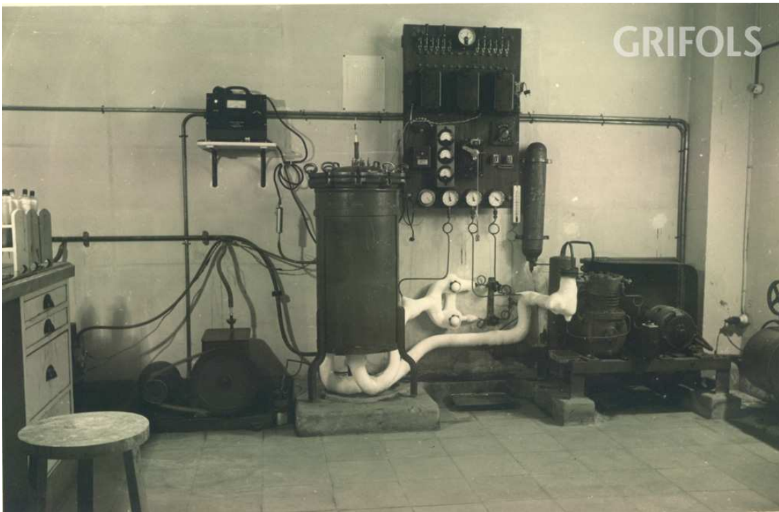
Primer liofilitzador de plasma fabricat a Laboratoris Grífols el 1943.

Mitjançant objectes, documentació i material audiovisual, s'expliquen el funcionament i l'abast d'aquestes contribucions pioneres dels Laboratoris Grífols, fundats el 1940 a Barcelona, i especialitzats en l'anàlisi clínica, la fabricació de vacunes i les transfusions.