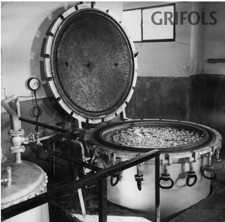
Autoclau per a esterilitzar solucions venoses, dècada de 1960.

La mostra es podrà veure fins al mes de juliol de 2016 al mNACTEC.