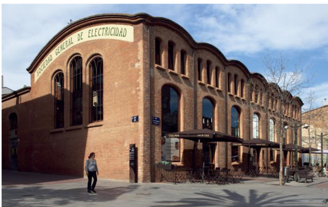
Societat General d'Electricitat (Terrassa) / Teresa Llordés

L'últim àmbit de l'exposició està dedicat a la tendència creixent entre restaurants i botigues d'aprofitar les característiques pròpies dels antics edificis industrials per oferir als seus clients un entorn diferent, acollidor i ple d'atractiu visual i històric per vendre el seu producte. Un cas il·lustratiu és el de l'empresa de restauració Viena, que va aprofitar les característiques arquitectòniques de l'antiga fàbrica de velluts Can Turuguet, a Castellar del Vallès, per col·locar un dels seus establiments.