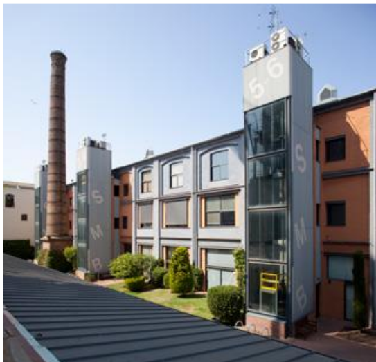
Fàbrica Massó i Carol (Barcelona) / Teresa Llordés

Agafant com a exemple els lofts novaiorquesos, aquest àmbit presenta intervencions de transformació d'antigues naus en espais per a viure-hi, en els quals l'amplitud és un factor determinant. A les imatges següents es pot apreciar l'aspecte actual de l'antiga Fàbrica Massó i Carol, a Barcelona, i la Fàbrica Font Batallé, a Terrassa, reconvertides per allotjar-hi habitatges i oficines.