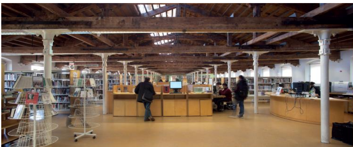
Vapor Vell de Sants (Barcelona) / Teresa Llordés

En aquesta part, es destaca com l'aprofitament de la llum natural de les fàbriques amb claraboies o grans finestrals va facilitar la conversió d'un gran nombre d'edificis industrials en sales de lectura. Alguns exemples d'aquest tipus de rehabilitació els trobem en la biblioteca del Vapor Vell de Sants (Barcelona) o l'Escorxador de Manresa, que actualment acull la biblioteca de la Universitat Politècnica.