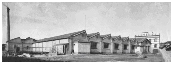
Autor desconegut / Col·lecció Josep M re Vilumara