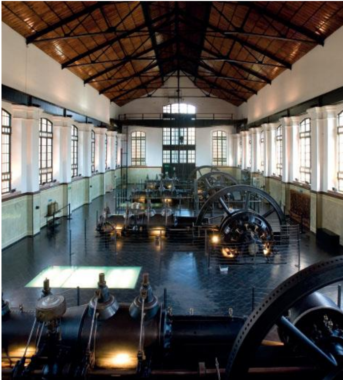
Central Cornellà de la Soc. Gral. d'Aigües de Barcelona (Cornellà) / Teresa Llordés