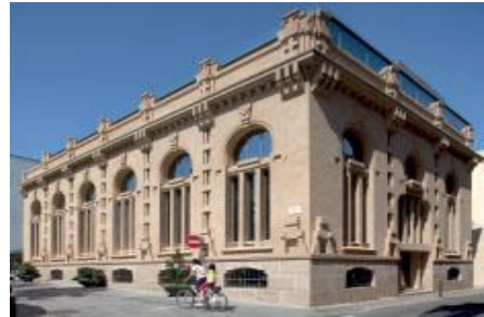
Central elèctrica "La Energía" (Sabadell) / Teresa Llordés