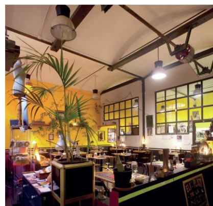
Vapor Ros (Terrassa) / Teresa Llordés