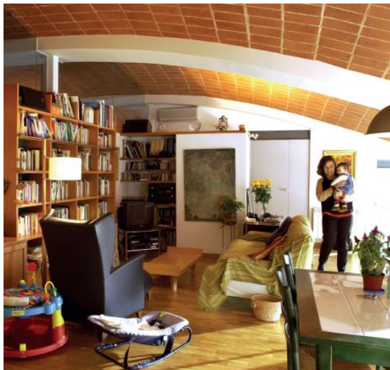
Fàbrica Font Batallé (Terrassa) / Teresa Llordés