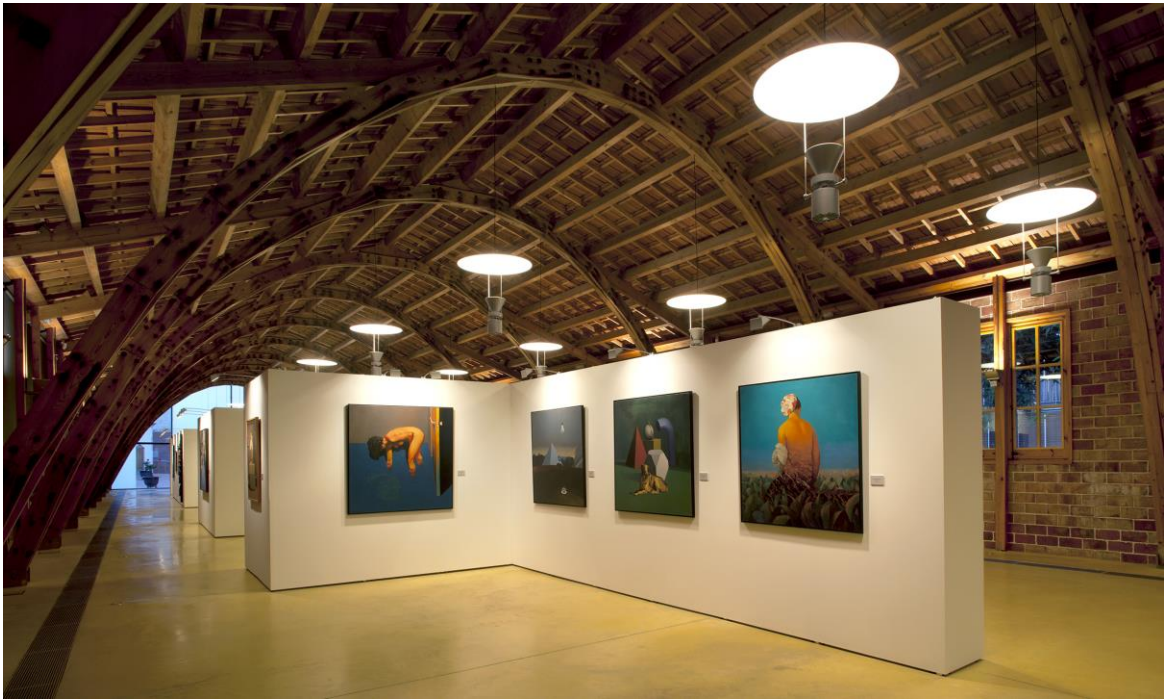
Nau Gaudí de La Obrera Mataronense (Mataró) / Teresa Llordés