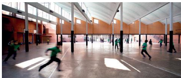
Tallers Manyach (Terrassa) / Teresa Llordés