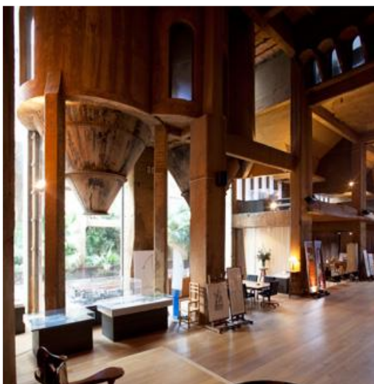
Cimentera Sanson / Teresa Llordés

En aquest àmbit el visitant podrà conèixer un dels projectes pioners de recuperació del patrimoni industrial a l'Estat espanyol, la reutilització de la cimentera Sanson, entre els anys 1973 i 1975. Ubicada a Sant Just Desvern, una part del complex industrial va ser transformada per convertir-se en l'habitatge i el taller de l'arquitecte Ricard Bofill.