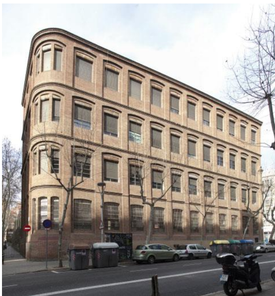
La Sedeta (Barcelona)

Als anys vuitanta, els primers esforços de recuperació del patrimoni industrial es van centrar en els edificis de major interès arquitectònic: els modernistes, noucentistes i racionalistes. L'Administració va promoure un seguit de rehabilitacions per crear equipaments culturals, incloent-hi museus, sales d'exposicions i biblioteques. També va ser molt popular la iniciativa de convertir els edificis industrials en escoles o centres cívics, com va ser el cas de la fàbrica tèxtil La Sedeta o la fàbrica de cotó Can Felipa, ambdues a Barcelona.