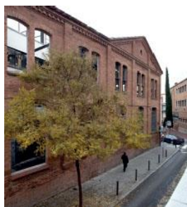
Fàbrica Marçet (Terrassa) / Teresa Llordés