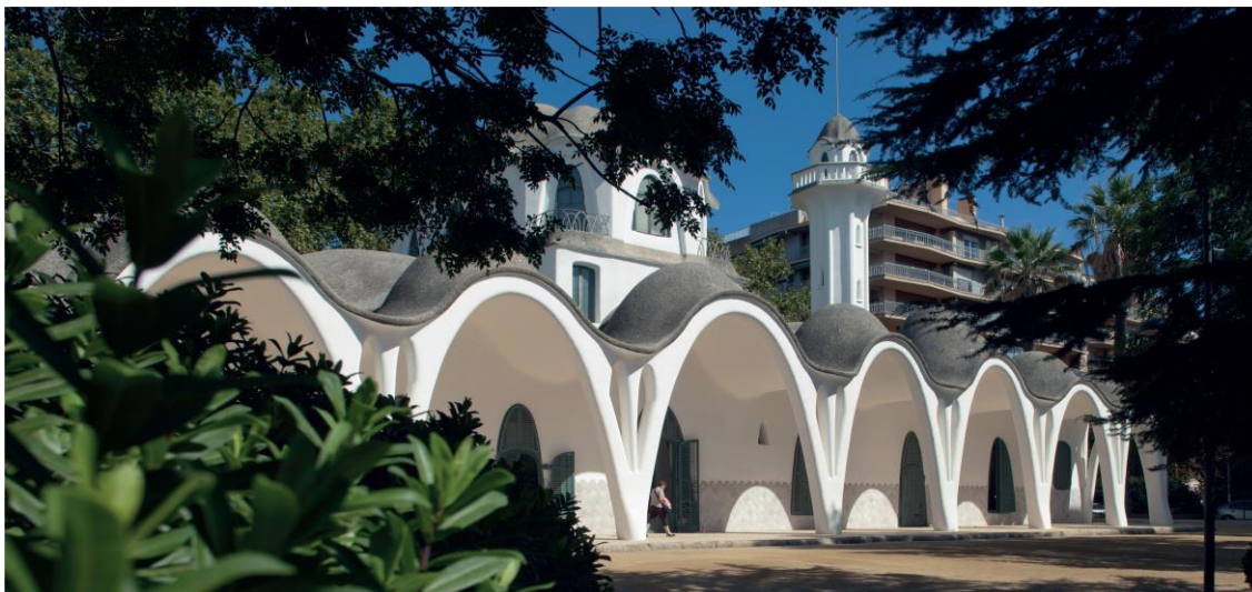
Masia Freixa (Terrassa)

A principis del segle XX ja es troben exemples de reutilització de naus industrials per a usos diferents de l'original, com ara la nau industrial que a Terrassa es converteix en un habitatge singular, la Masia Freixa.