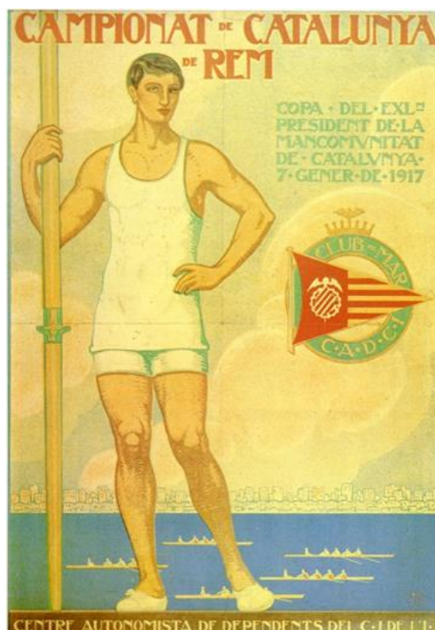
Cartell del Campionat de Catalunya de rem organitzat pel CADCI. Barcelona, 1917.

L'Estat entén l'esport com un element socialitzador i identitari, per la qual cosa estableix les primeres polítiques esportives i promou l'olimpisme modern. El moviment olímpic modern és el màxim exponent internacional de la reglamentació esportiva i un gran element de difusió de l'esport. Els impulsors de l'olimpisme modern a Catalunya són Narcís Masferrer i Sala, Josep M. Co de Triola i Elias Juncosa, periodistes i esportistes, que el 1913 creen el Comitè Olímpic Català.