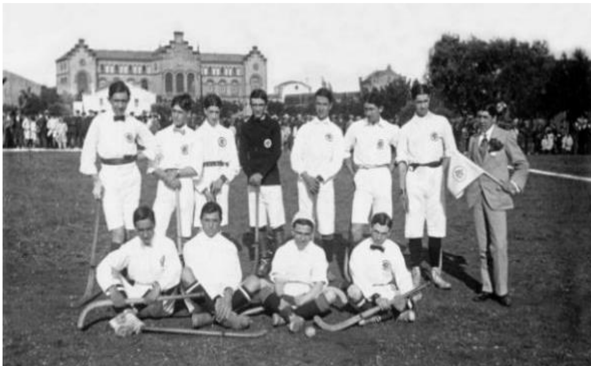
Primer partit d'hoquei herba a Terrassa, Camp d'en Mauri, davant l'Escola Industrial, any 1912. Equip del Lawn Hockey Club Calassanci, Terrassa.