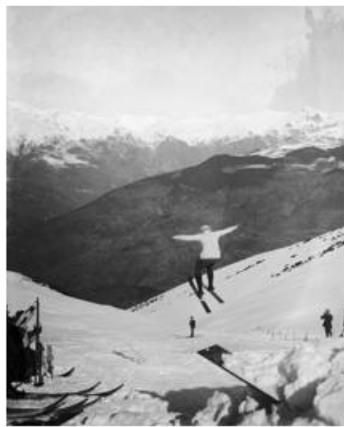
El Pedraforca des de la Vall del Gresolet i esquiador fent un salt de trampolí a Ribes de Freser l'any 1912