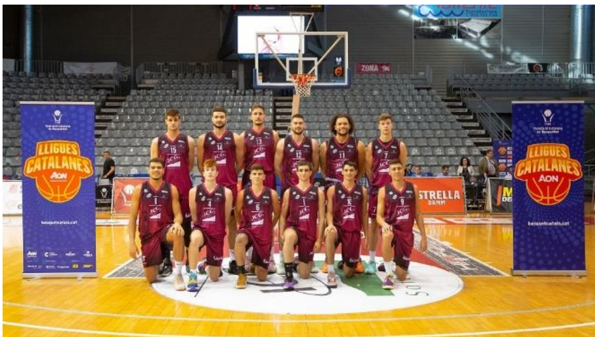
Equip de la Lliga Catalana AON. Masculina moderna, 2022

L'evolució en l'àmbit reglamentari ha establert aspectes de la pràctica esportiva com la indumentària, el nombre d'integrants dels equips i els accessoris que s'utilitzen per a cada esport.