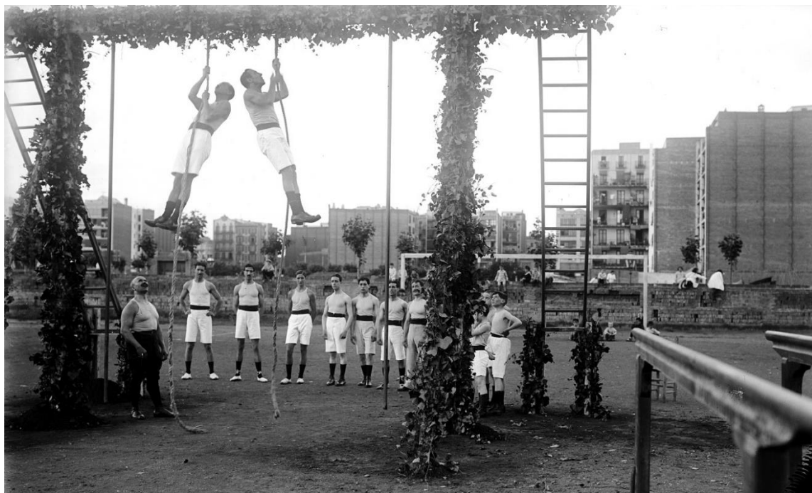
Festival atlètic del Gimnàs Vila al camp del Català Sport Club. Barcelona, 1915

L'expansió de l'esport a Catalunya està vinculada a l'activitat comercial i industrial de les ciutats i zones on arriben tècnics industrials, comercials o diplomàtics que coneixen els esports moderns i els transmeten als ciutadans locals. Per tant, és a les ciutats i zones més industrialitzades on es desenvolupen els esports moderns.