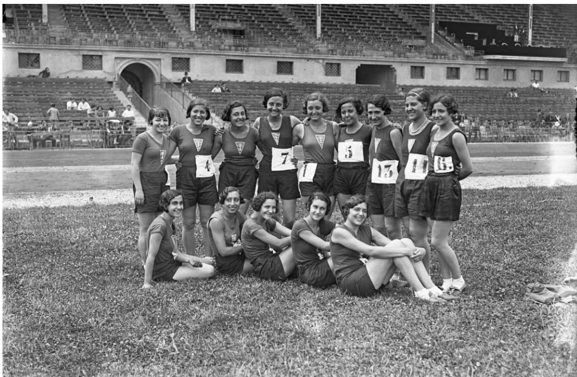
Atletes del Club Femení d'Esports a l'Estadi de Montjuïc de Barcelona, entre 1930 i 1935

A partir dels anys trenta, la pràctica esportiva femenina es consolida. Es creen seccions femenines d'esports, les dones participen més en les competicions, s'integren en les xarxes associatives i arriben a formar part de la direcció de clubs esportius.