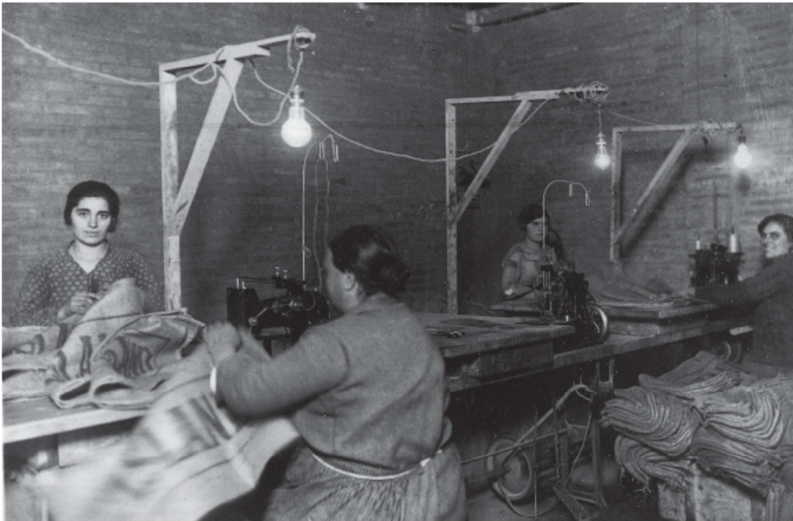
Dones a la fàbrica de Montcada i Reixac

Aquest àmbit de l'exposició està dedicat a explicar l'impacte que va tenir l'empresa en els territoris i els diferents serveis —com ara escoles o economats—, que es van crear per donar resposta a les demandes dels treballadors.