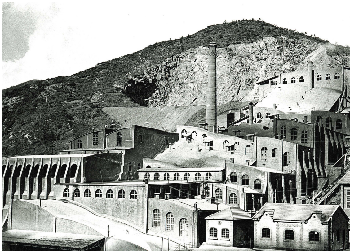
Asland a Castellar de n'Hug

El segon àmbit fa un recorregut de la trajectòria de l'empresa Asland, avui en dia integrada dins del grup LafargeHolcim. En aquesta part, el visitant podrà descobrir com va néixer l'empresa a principis del s.XX, per què les primeres fàbriques es van instal·lar a Clot de Moro (entre la Pobla de Lillet i Castellar de n'Hug) i Montcada i Reixac, i fins a quin punt aquesta empresa centenària s'ha expandit per gran part del territori espanyol, fins arribar a fusionar-se amb l'empresa Holcim l'any 2015.