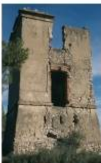
Torre del Telègraf de l'Ordal, Subirats