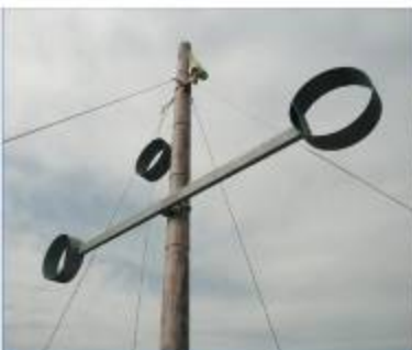
Torre del Telègraf, Montornès del Vallès