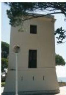
Torre de l'Esquirol, Cambrils