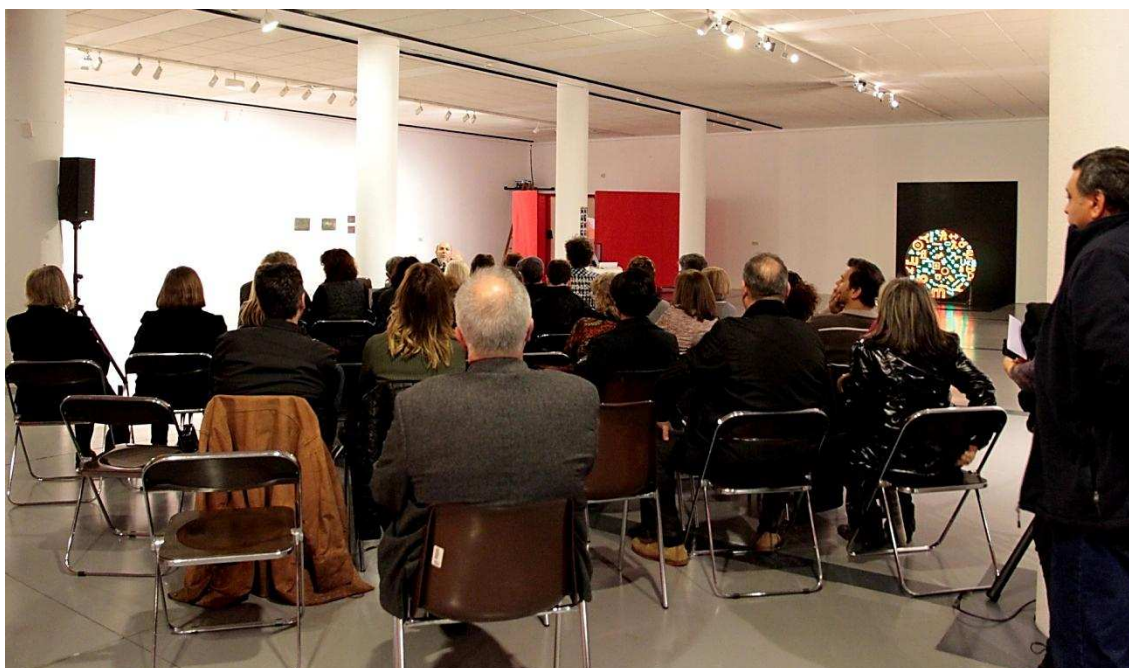
Inauguració de l'ESPAId'ARTS

El mNACTEC aposta per la innovació i, en aquesta línia d'actuació, l'espai acollirà exposicions que es desenvolupin en un marc de sinèrgia entre branques humanístiques i científiques.