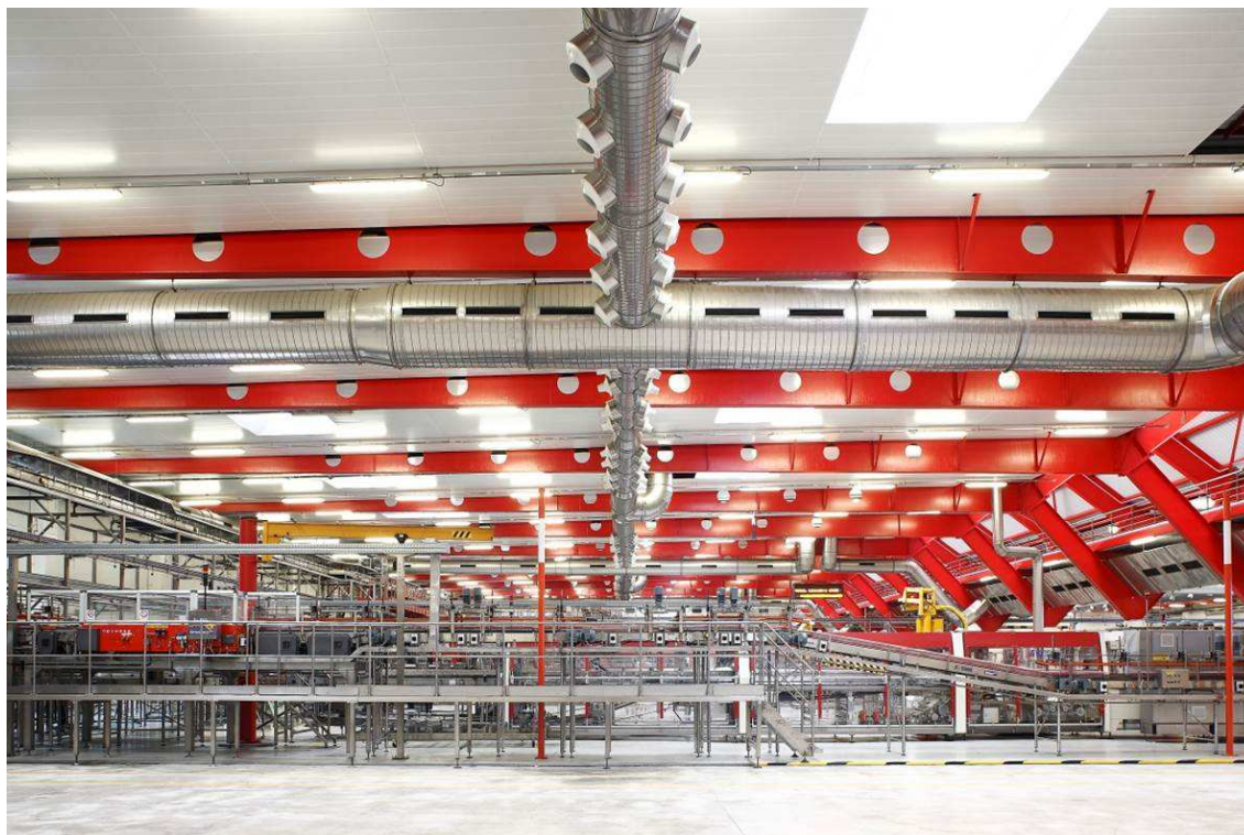
Detalls del tren d'envasat de llaunes. Damm, El Prat de Llobregat

De la mateixa manera que la indústria processa les matèries primeres per transformar-les en objectes de consum, la intenció d'aquest projecte és prendre la indústria com a matèria primera i transformar-la en un objecte visual, d'interès cultural. Construir un diàleg entre indústria i societat. Entre art i tecnologia. Una aventura fotogràfica a través de la indústria.